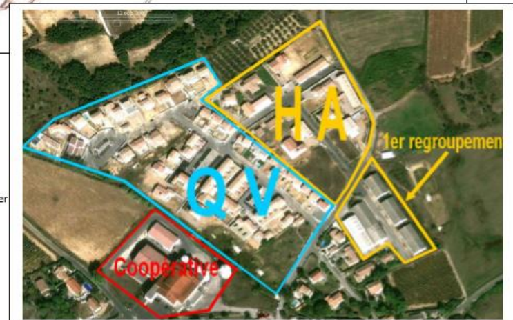
Photo n° 14 : Implantation du quartier vigneron entre la cave coopérative et le 1 er regroupement de hangars agricoles