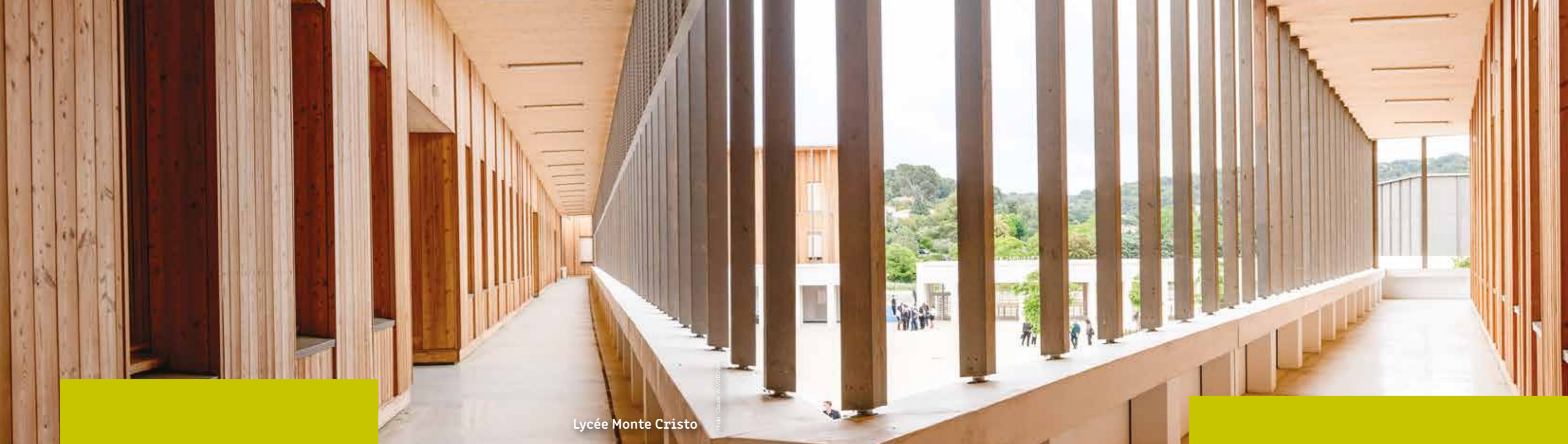
Lycée Monte Cristo