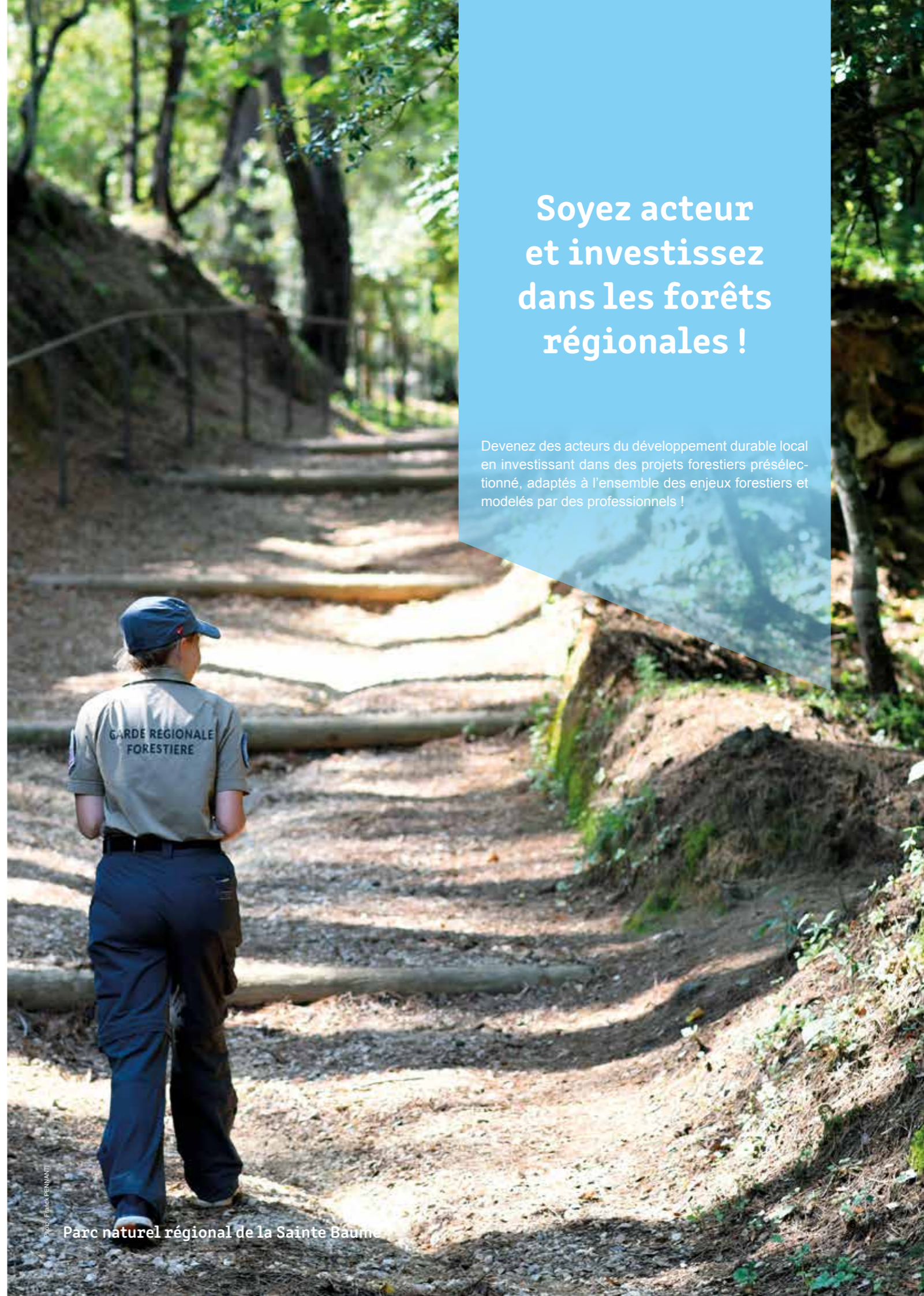
Parc naturel régional de la Sainte Baume

Devenez des acteurs du développement durable local en investissant dans des projets forestiers présélectionnés, adaptés à l'ensemble des enjeux forestiers et modelés par des professionnels !