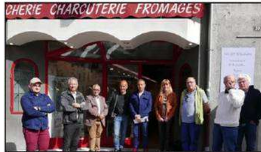
La boutique à l'essai de la rue Maurice Petsche a été inaugurée.

Une nouvelle boutique à l'essai va ouvrir ses portes le 3 juin prochain dans le centre-ville de Guillestre.