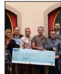
La remise symbolique du chèque de 4 750 € de la Plle, la plateforme locale d'initiative emploi.

Chercheur de minéraux, chineur, peintre, sculpteur, il transforme tout de ses mains. Ce lieu bien à lui, il le veut avant tout artistique.