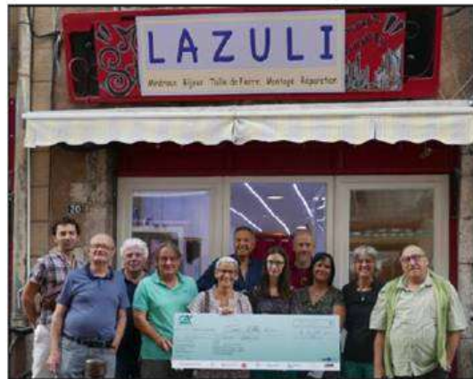
L'inauguration de cette nouvelle boutique à l'essai s'est déroulée en présence de la famille Bergues, de la propriétaire du local, des élus et des représentants de la plateforme Initiative nord Hautes-Alpes.

C'est la quatrième du genre sur le territoire, tandis qu'un nouveau local va être mis à disposition.